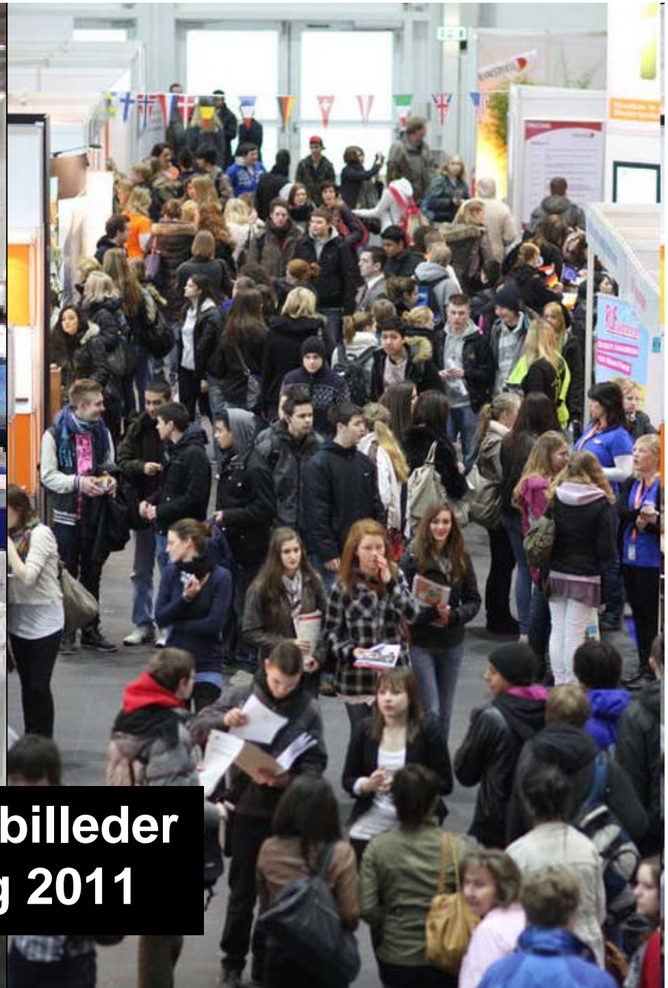
Generelle stemningsbilleder fra Einstieg Hamburg 2011