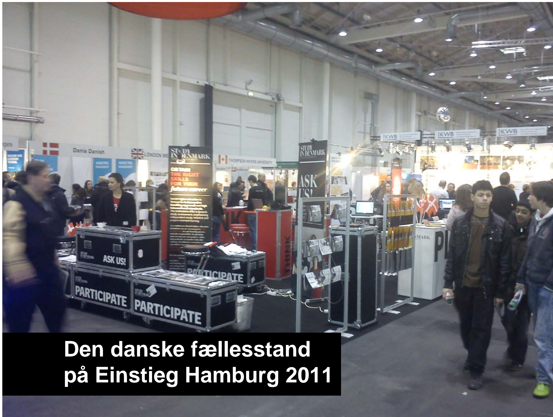
Den danske fællesstand på Einstieg Hamburg 2011