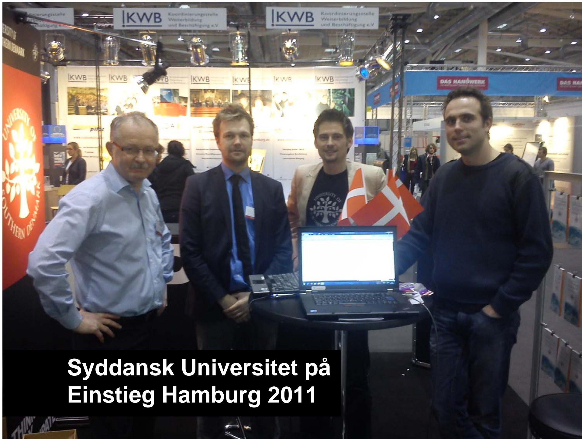
Syddansk Universitet på Einstieg Hamburg 2011