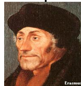
Erasmus-programmet Videregående uddannelser