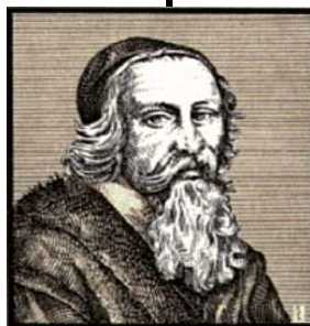
Comenius-programmet Grundskole og gymnasium